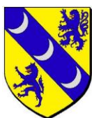
La commune de Goult

www.goult.fr CONTACT : sps2023goult@orange.fr