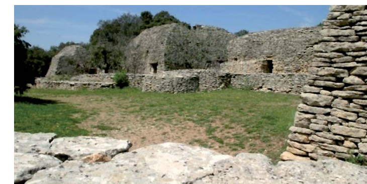
Le Village des bories, à Gordes, est classé monument historique

Le patrimoine en pierre sèche peut faire partie d'une aire de valorisation de l'architecture et du patrimoine (AVAP), forme de protection du même type que le site mais assortie d'un règlement architectural à partir duquel sont délivrées les autorisations de travaux par l'Architecte des Bâtiments de France. Elle remplace la ZPPAUP. L'étude d'une aire nécessite l'établissement d'un rapport de présentation du patrimoine et d'un règlement, justifiés par un ensemble remarquable. Art. L 642 du Code du patrimoine