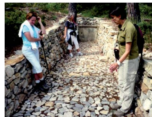
Caromb, ENS du Paty : ancienne fontaine du site pastoral, réhabilités par le CFPPA de Carpentras-Serres

Les Espaces naturels sensibles des départements (ENS) sont un mode de protection assorti d'un plan de gestion, l'espace patrimonial étant acquis par la puissance publique en vue de son « ménagement » et de son ouverture au public.