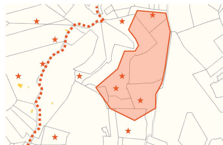
Exemple d'inventaire cartographié de cabanes, de mur remarquable et de zone de restanques sur un fond cadastral, à annexer au PLU pour identifier les constructions protégées

Ainsi peut-on formuler dans le règlement du PLU : « Sur l'ensemble du territoire de la commune, la démolition des constructions en pierre sèche mentionnées dans l'inventaire annexé au PLU, est strictement interdite sauf autorisation exceptionnelle dûment justifiée et délivrée par le Maire dans le cas d'une demande de permis de démolir ».