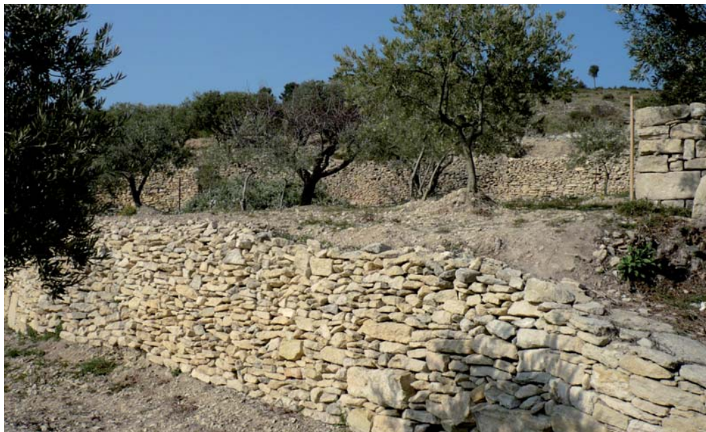
Caromb, ENS du Paty: bancaus de la Pré Fantasti, réhabilités par l'UPR du Ventoux